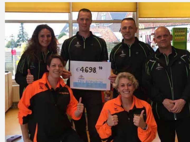
Zwartewaal - OBS 't Want Mooi bedrag Roparun Dankzij het harde werken van de kinderen van OBS 't Want is er maar liefst € 4.698,10 opgehaald.