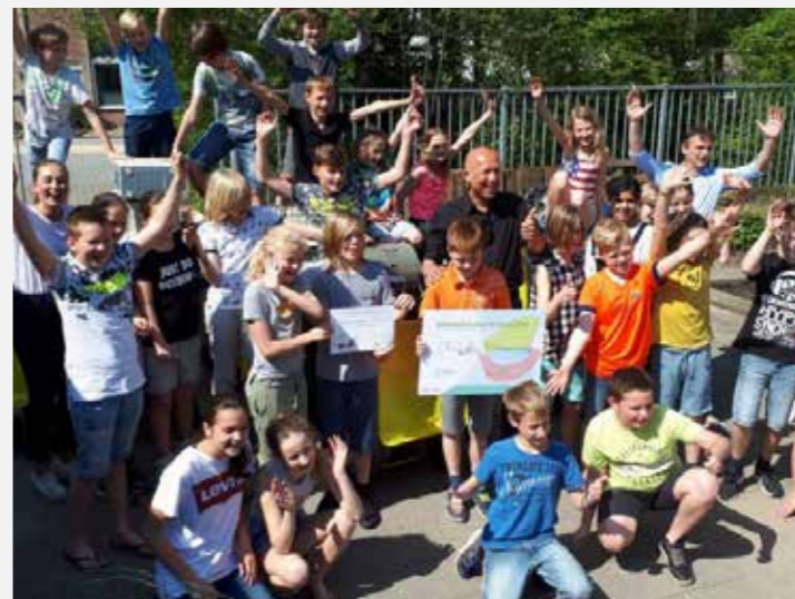
Geervliet - OBS Markenburg Werken aan duurzaamheid Met de inzameling van 10.234 stuks afval wint OBS Markenburg op 20 april de E-waste Race Nissewaard.