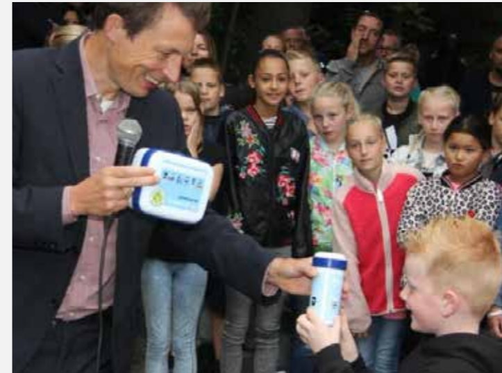
Oostvoorne - OBS De Bosrand Eerste afvalvrije school Op 29 augustus opent OBS De Bosrand in Oostvoorne haar deuren, hiermee is de eerste afvalvrije school op Voorne-Putten een feit.