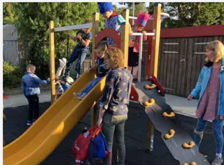
Abbenbroek - OBS De Vliegerdt Leerlingen bedenken schoolplein De leerlingenraad van OBS De Vliegerdt ontwerpt een nieuw schoolplein met voor ieder wat wils.