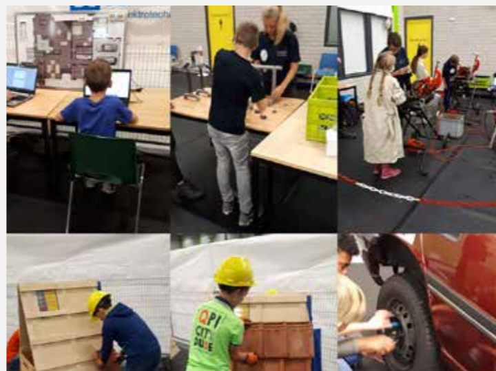
Vierpolders - OBS De Tiende Penning Techniek ontwikkelen Groep 7/8 leerlingen van OBS De Tiende Penning ontwikkelen hun technische vaardigheden tijdens techniekevent Tech2Do.