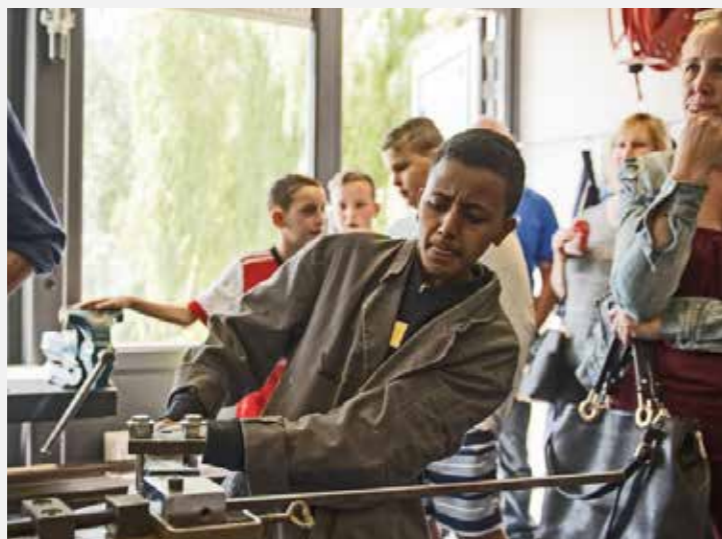
Brielle - VSO Maarland 'Werken-en-leren' in de schijnwerpers Maar liefst 300 belangstellenden komen op 23 juni naar de Open Dag van VSO Maarland.